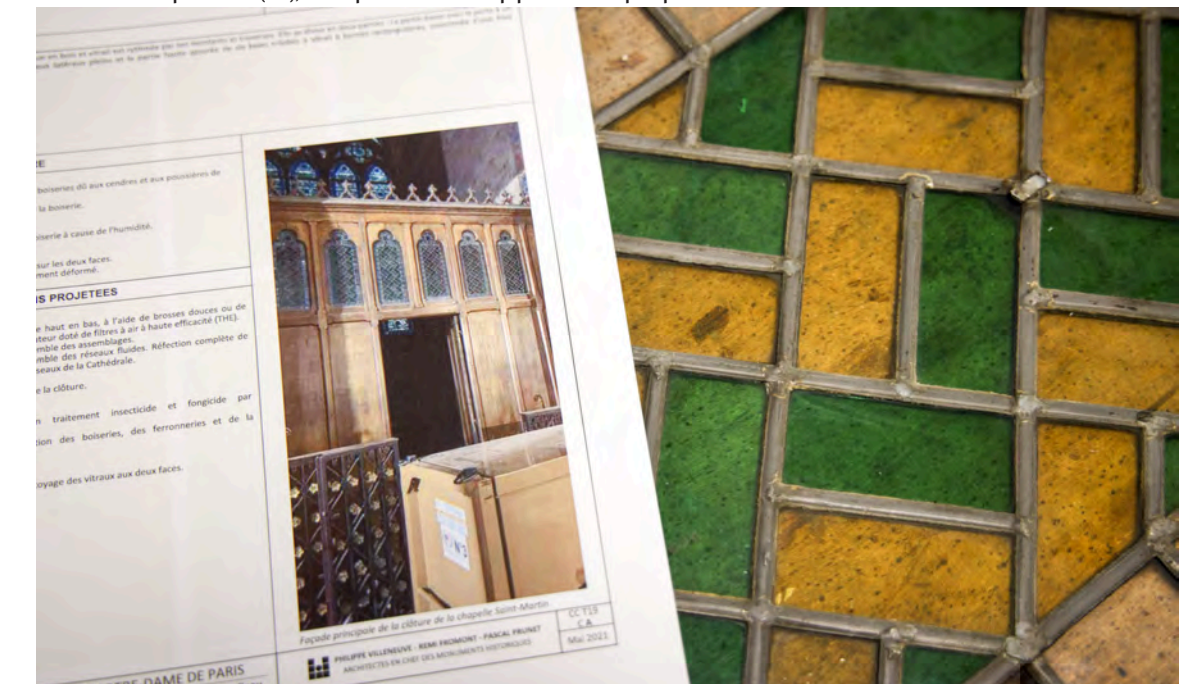
ATB et Vitrail Ombre & Lumière vont prendre soin des portes en bois de cinq chapelles sur lesquelles se trouvent des vitraux. Remi Waffart